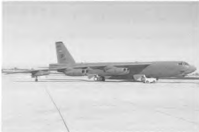
De Air Force Reserves kwamen met Heavy Metal: een B-52G van het 93 e BS van Barksdale AFB.