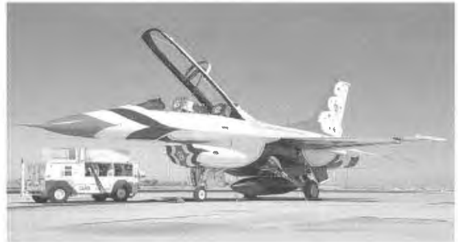
De taxi van de Thunderbirds, een dubbelzits Viper, staat klaar voor de terugtrip naar Nellis AFB.

Na het optreden van de Thunderbirds was het officiële programma ten einde en werden bezoekers met bussen teruggebracht naar de parkeerplaatsen. Dat ging niet erg snel en daardoor bleef het ook lang druk op de static. Uiteindelijk lukte het ons na veel geduld om de meeste kisten die we op vrijdag nog niet hadden kunnen platen mooi te nemen. De volgende dag reden we terug naar San Diego om huiswaarts te vliegen. Dat we tijdens die rit naar San Diego nog in 20 centimeter sneeuw zouden belanden konden we toen nog niet bevroeden.