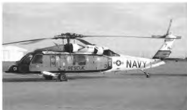
Nadat het grote publiek was vertrokken konden we deze Navy 'Knighthawk' in een mooi avondzonnetje platen.

praten met de leden van de Blue Angels en andere bemanningen die deelnemen aan de vliegshow. In Nederland zou het tijdens zo'n evenement een drukte van belang zijn, op El Centro vonden wij het rustig. Er was ook een vuurwerkshow georganiseerd dat in Disney World niet zou misstaan, maar dat duurde zó lang, dat wij maar besloten weg te gaan voordat de laatste pijl werd afgeschoten.