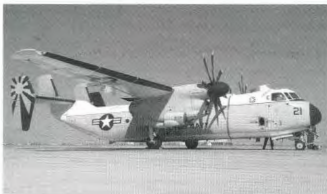
Deze C-2A Greyhound heeft het Service Life Extension Program (SLEP) achter de rug en mag, ook van ons, nog vele jaren in dienst blijven!

vinden op de static. De rest van de show werd gevuld met wat warbirds en civiele demo's. Als sluitstuk stonden halverwege de middag de Blue Angels op het programma. Bij het opstarten bleek een van de F-18's kuren te vertonen en moest de piloot snel naar een reservekist op de flightline verkassen. Daarna een leuk optreden van de Blauwe Engelen. Al tijdens het lange optreden besloten veel bezoekers met hun kinderen de open dag te verlaten. In grote drommen zochten ze hun opgewarmde auto's weer op. De drukte viel overigens erg mee. Wij schatten in dat er zo'n 30.000 toeschouwers waren, heel wat anders dan een open dag van de KLu.