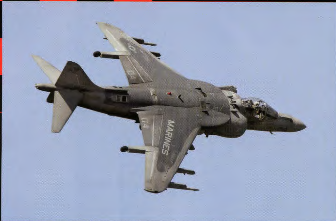
In het Zuidwesten van de Verenigde Staten kun je de Harrier nog tegenkomen, en wel in de AV-8B uitvoering van het US Marine Corps. (MCAS Yuma, 16-3-2012,)