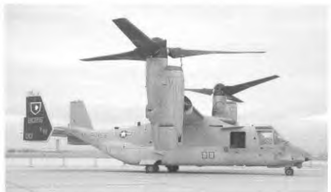
De commandant van VMM-165 vliegt rond in deze gekleurde MV-22B Osprey.

Na het optreden van de Thunderbirds was het officiële programma ten einde en werden bezoekers met bussen teruggebracht naar de parkeerplaatsen. Dat ging niet erg snel en daardoor bleef het ook lang druk op de static. Uiteindelijk lukte het ons na veel geduld om de meeste kisten die we op vrijdag nog niet hadden kunnen platen mooi te nemen. De volgende dag reden we terug naar San Diego om huiswaarts te vliegen. Dat we tijdens die rit naar San Diego nog in 20 centimeter sneeuw zouden belanden konden we toen nog niet bevroeden.