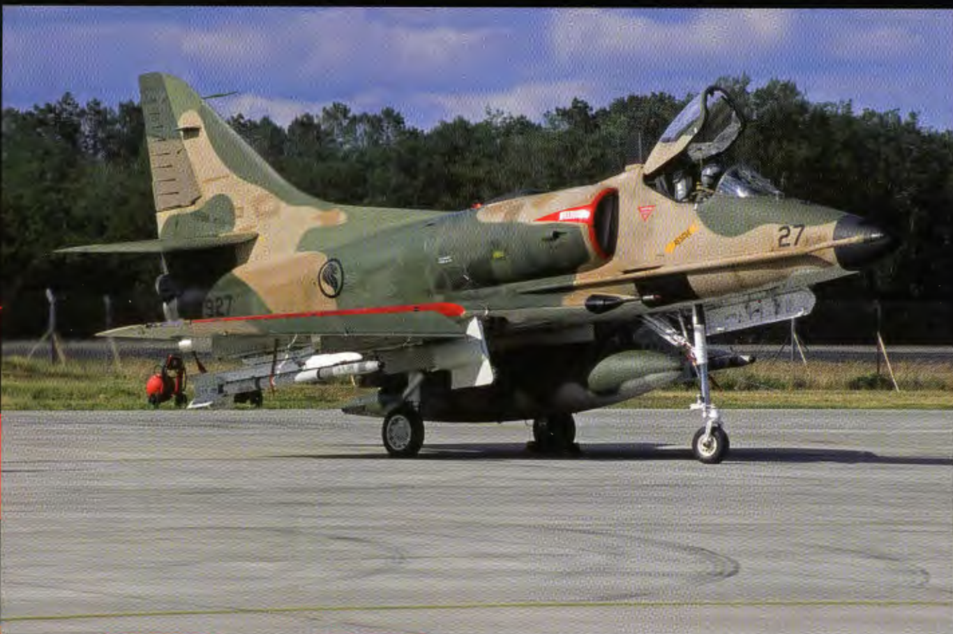
Deze A-4 is klaar om terug te vliegen naar Cazaux. In 2013 zullen de A-4's van Singapore helaas uit dienst genomen worden. (Mont-de-Marsan, 3-6-2012, Leén Palsrok)