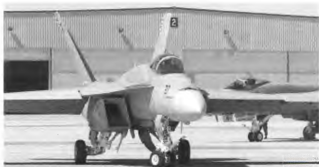
De Super Hornet-versie onderscheidt zich van de Hornet door o.a. zijn rechthoekige inlaat. F/A-18E 166959/217 van VFA-122 taxiëert uit voor een puik demo.

De open dag viel dit jaar op zaterdag 10 maart. Wij arriveerden in de late middag van de vrijdag daarvoor bij ons hotel in El Centro; we wilden namelijk 's avonds deelnemen aan het Annual Entertainment & Food Festival, dat elk jaar op de basis gehouden wordt aan de vooravond van de open dag. In één van de hangaars verkopen lokale bedrijven hun etenswaren en terwijl je daarvan geniet kun je ongedwongen